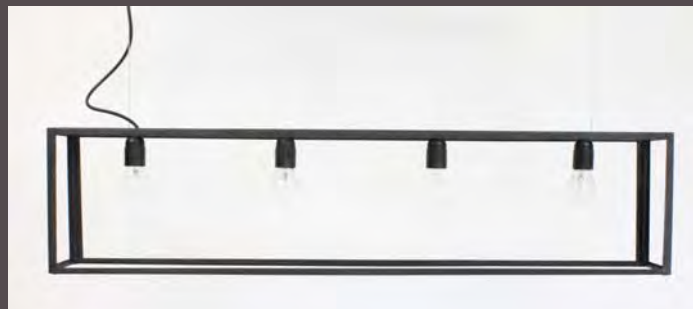
SUSPENSION LOFT G.M - 5090 Long. 1100 mm - Haut. 250 mm - Larg. 135 mm E. 27 - 4 x 52 W - Classe I Verre clair ep. 3mm (en Finition N°23 sur photo - Métal fumé)