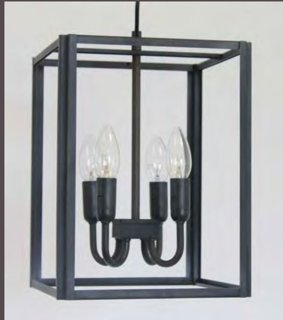
SUSPENSION CRAFT M.M - 5125

(en Finition N°23 sur photo - Métal fumé)