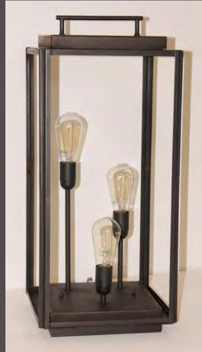
PHOTOPHORE ELECTRIFIE HT 70CM – LOUNG/EL70

Haut. 540 mm - Larg. 225 mm - Long. 225 mm Verre clair 3 mm - Poids : 6kg E. 27 - 52 W maxi - Classe II - IP44 Long. Cordon 3M - Interrupteur à pied Possibilité de fixation au sol (en finition N°23 sur photo - Métal Fumé)