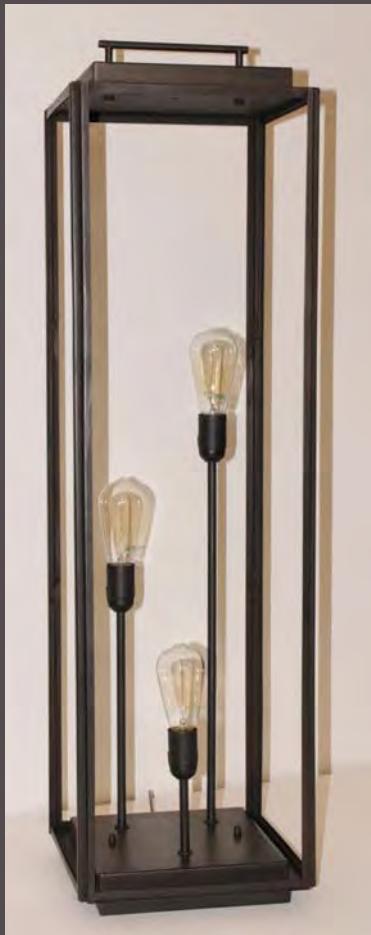
LAMPADAIRE LOUNGE ELECTRIFIE HT 1.10M – LPD LOUNG I 10

Haut. 700 mm - Larg. 300 mm - Long. 300 mm Verre clair 3 mm - Poids : 9kg E. 27 - 3X52 W maxi - Classe I - IP44 Long. Cordon 3M - Interrupteur à pied Possibilité de fixation au sol (en finition N°23 sur photo - Métal Fumé)