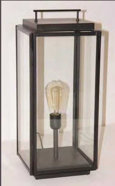
PHOTOPHORE ELECTRIFIE HT 54CM – LOUNG/EL54

Haut. 540 mm - Larg. 225 mm - Long. 225 mm Verre clair 3 mm - Poids : 6kg E. 27 - 52 W maxi - Classe II - IP44 Long. Cordon 3M - Interrupteur à pied Possibilité de fixation au sol (en finition N°23 sur photo - Métal Fumé)