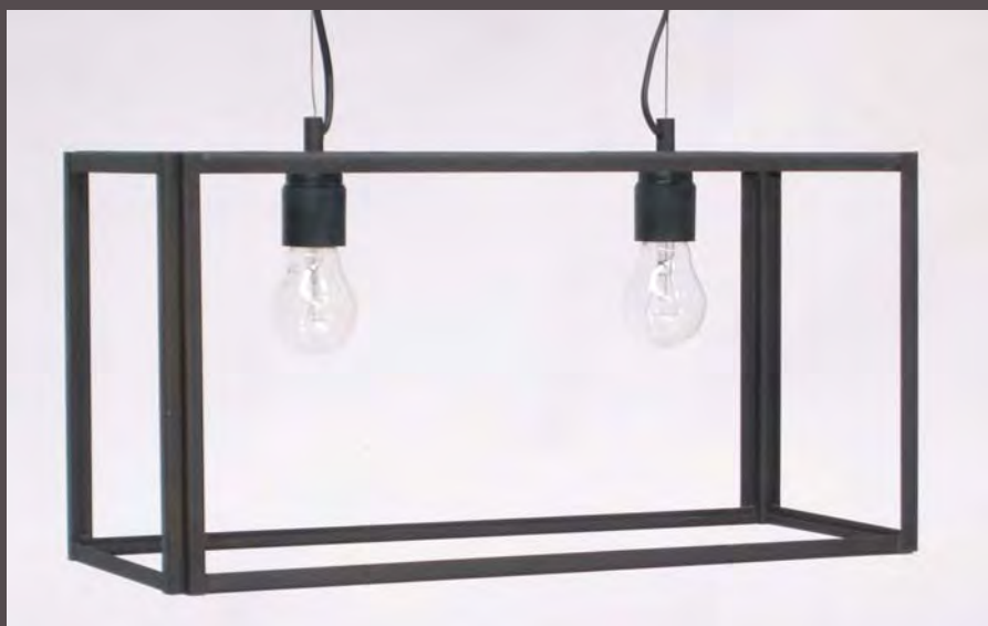
SUSPENSION LOFT G.M - 5070 Long. 500 mm - Haut. 250 mm - Larg. 135 mm E. 27 - 2 x 52 W - Classe I Verre clair ep. 3mm (en Finition N°23 sur photo - Métal fumé)