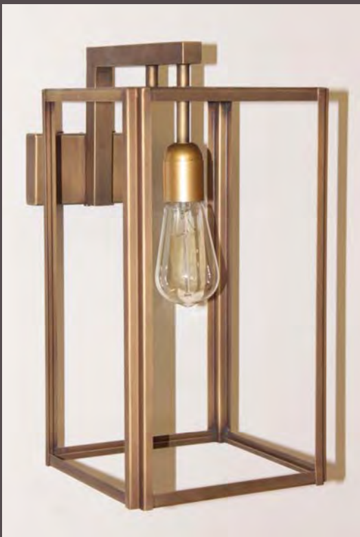
APPLIQUE LOFT DEPORTEE | LUMIERE EXTERIEUR – 9070

Haut. 325mm - Long. 135mm - Saillie 210mm E. 27 - 52 W maxi - Classe I - IP 23 (en Finition N°23 sur photo - Métal fumé) Patère : 90x45 mm Ep.20 mm