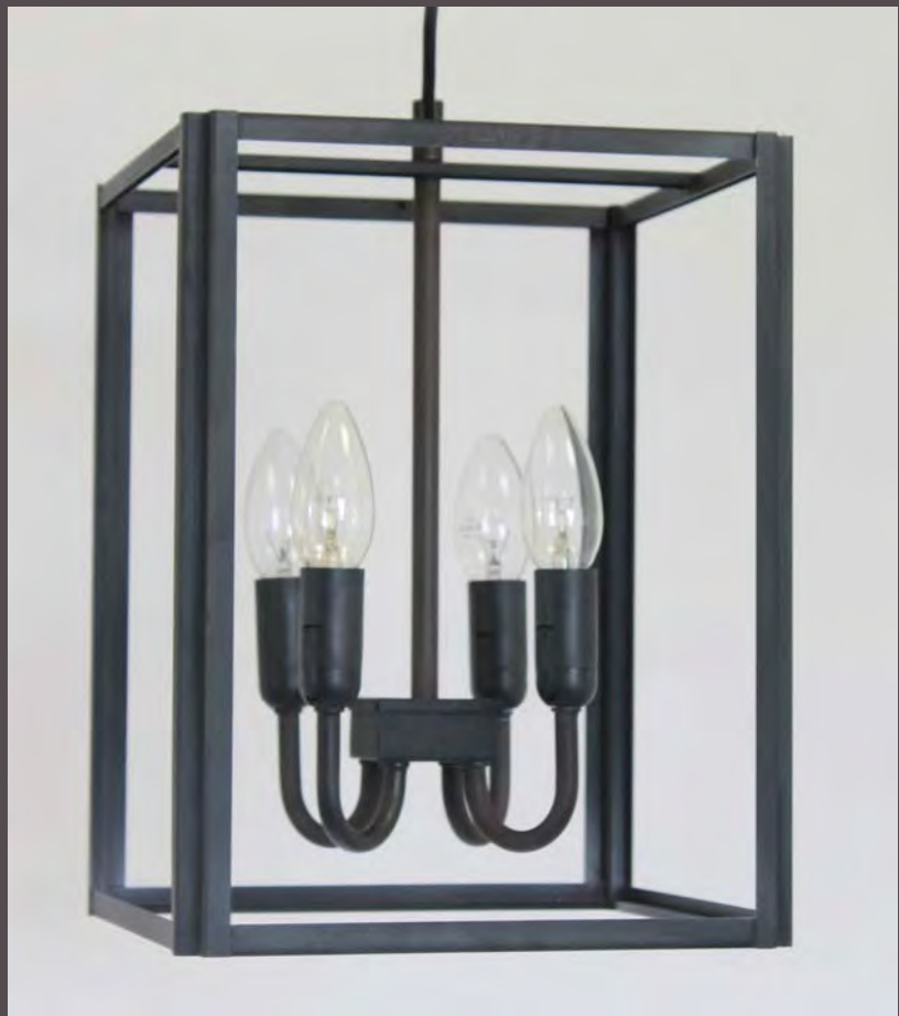
SUSPENSION CRAFT G.M - 5130

(en Finition N°23 sur photo - Métal fumé)