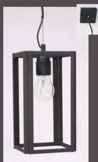
SUSPENSION LOFT P.M - 5050 Long. 135 mm - Haut. 250 mm - Larg. 135 mm E. 27 - 52 W - Classe II Verre clair ep. 3mm (en Finition N°23 sur photo - Métal fumé)