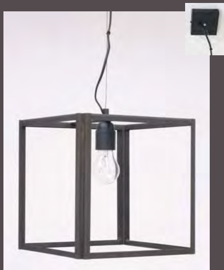
SUSPENSION LOFT M.M - 5060 Long. 250 mm - Haut. 250 mm - Larg. 250 mm E. 27 - 52 W - Classe II Verre clair ep. 3mm (en Finition N°23 sur photo - Métal fumé)