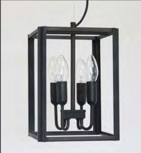
SUSPENSION CRAFT P.M - 5120

Haut. 280 mm - Larg. 200 mm E. 14 - 4 x 42 W - Classe I Verre clair ep. 3mm