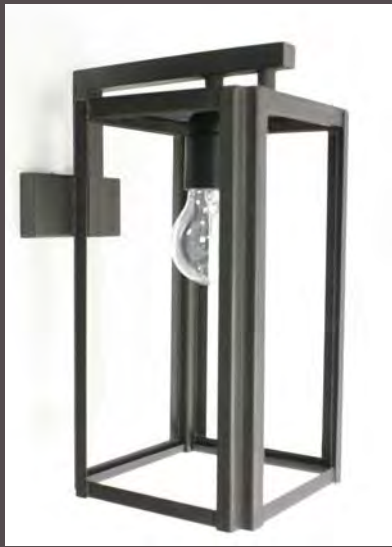
APPLIQUE LOFT DEPORTEE | LUMIERE EXTERIEUR – 9050

Haut. 300 mm - Long. 135mm - Saillie 210 mm E. 27 - 52 W maxi - Classe I - IP 23 (en Finition N°23 sur photo - Métal fumé) Patère : 90x45 mm Ep.20 mm