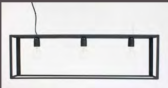
SUSPENSION LOFT G.M - 5080 Long. 850 mm - Haut. 250 mm - Larg. 135 mm E. 27 - 3 x 52 W - Classe I Verre clair ep. 3mm (en Finition N°23 sur photo - Métal fumé)